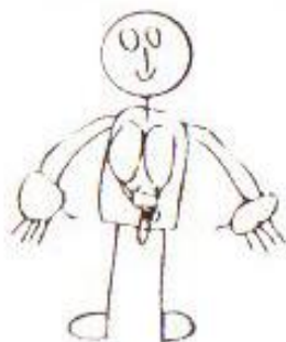
Энурез – не лучший источник вдохновения...

Эти рисунки лучшее тому доказательство. Ребенок всегда изображает то, что чувствует.